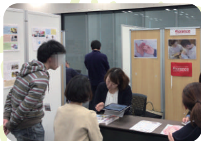
2019年よ~し相談ブース

特別養親組をされたご家族や養親希望のご夫婦を支援する 民間養子縁組団体のブースでは、活動の紹介やお話が聞けます。