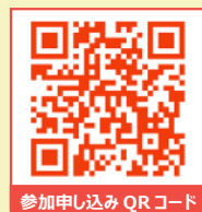
参加申し込み QRコード